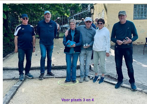
Voor plaats 3 en 4