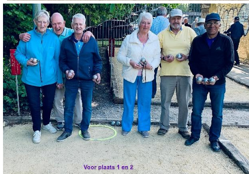
Voor plaats 1 en 2

Voor alle foto's zie onze website https://raak- putte- ertbrand.be/